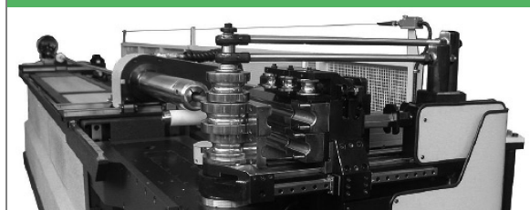
PROVAR 6 U-D