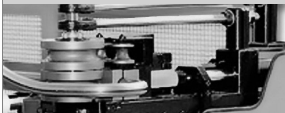
PROVAR 5 U-D