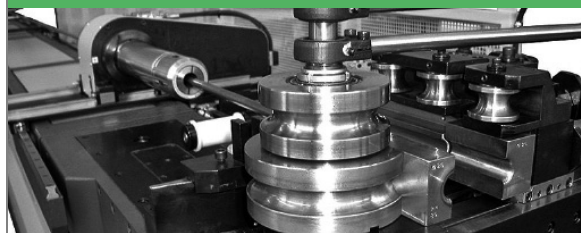
PROVAR 5 U-D